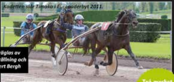
Kadetten slår Timoko i Europaderbyt 2011.

09.8a - 8 715 320 kr - 112 st: 26 - 19 - 9